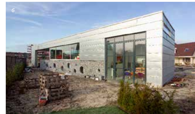
Ontwikkelingsplan (OPR) Roombeek van de Architecten Cie. (Pi de Bruijn)