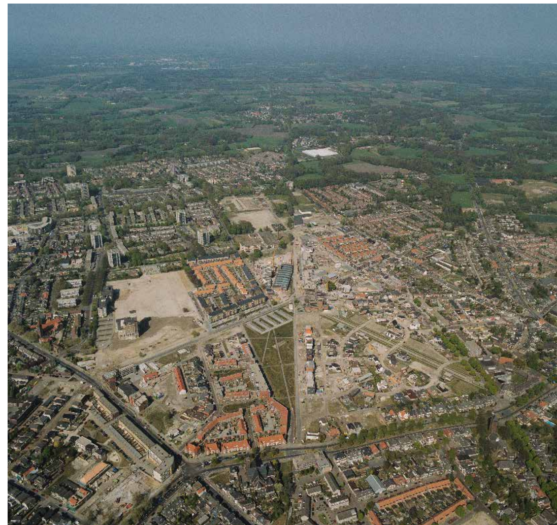
Plangebied Roombeek, met in het midden Lonnekerspooilaan

De wens om historische gebouwen te behouden en de opzet om veel ruimte voor cultuur te creëren, gingen vaak samen. Waardevolle gebouwen die verwijzen naar het (textiel)-verleden van Roombeek werden hergebruikt, al dan niet gecombineerd met nieuwbouw. Het oude fabrieksgebouw Roozendaal uit 1907 herbergt in de nabije toekomst het