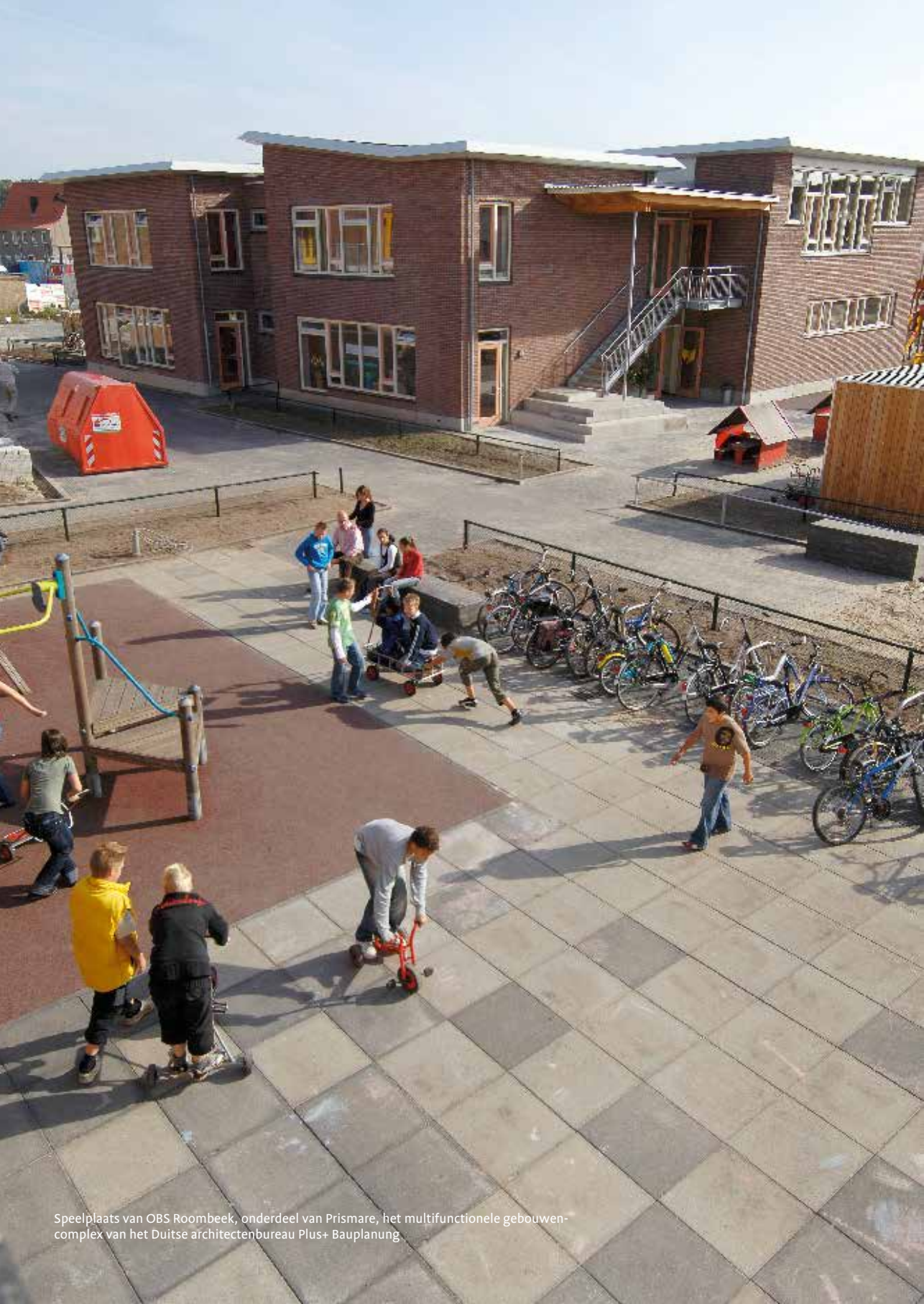
Speelplaats van OBS Roombeek, onderdeel van Prismare, het multifunctionele gebouwencomplex van het Duitse architectenbureau Plus+ Bauplanung