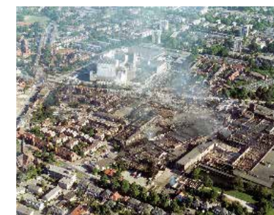
Roombeek vlak na de vuurwerkramp

Naast al deze ontwikkelingen werden er voor Roombeek extra financiële middelen vrijgemaakt om voorzieningen van bijzonder niveau te creëren. Deze hebben niet alleen een wijkfunctie, maar zijn ook van belang voor Enschede als geheel. Een voorbeeld hiervan is Prismare in het hart