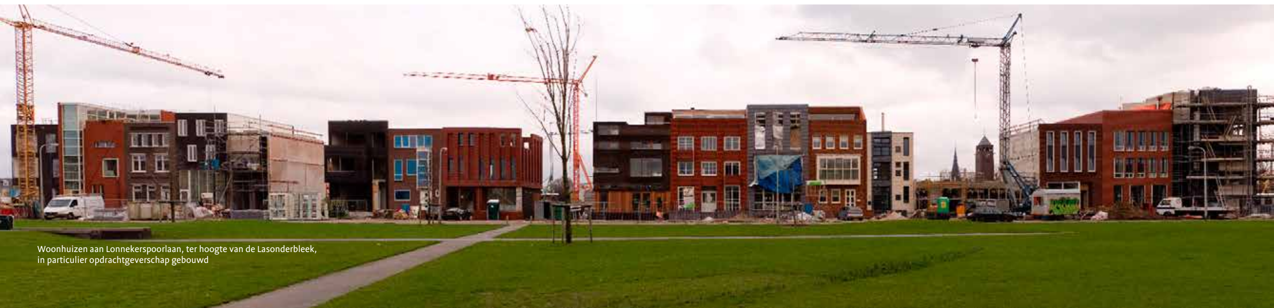
Woonhuizen aan Lonnekerspoorlaan, ter hoogte van de Lasonderbleek, in particulier opdrachtgeverschap gebouwd